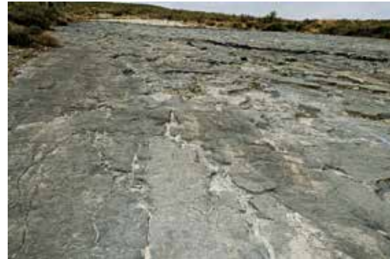
Yacimiento de la Era del Peladillo en Igea.

En estas zonas pantanosas o húmedas, las pisadas de grandes dinosaurios, tanto herbívoros como carnívoros, quedaron marcadas, y el paso del tiempo, la desecación y los sedimentos han hecho el resto