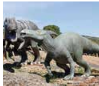
Yacimiento de Virgen del Campo, Enciso.

Aquí observarás muy bien conservadas las primeras huellas pertenecientes a un terópodo y otras de un posible grupo familiar. Para hacerte unas fotos tienes reproducciones a tamaño natural de varios dinosaurios.