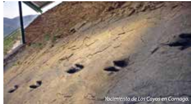
Yacimiento de Los Cayos en Cornago.

Seguimos la ruta y 3 kilómetros antes de Cornago , encontramos el conjunto de 5 yacimientos de Los Cayos , donde verás centenares de huellas de grandes dinosaurios carnívoros.