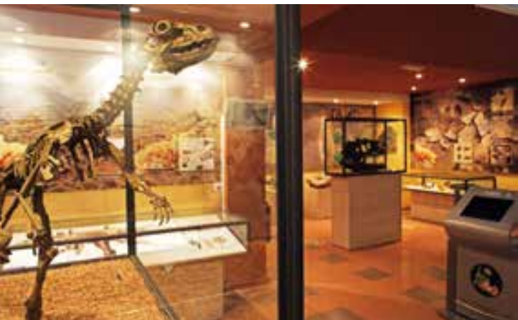
Centro de interpretación paleontológica de La Rioja en Igea.

Hace más de 120 millones de años los dinosaurios habitaban lo que ahora es La Rioja. En el siglo XX, los científicos descubrieron el significado de las huellas fósiles (icnitas) que la imaginación popular atribuía al caballo del apóstol Santiago. Desde entonces, las excavaciones y estudios han descubierto más de 110 yacimientos riojanos .... Acércate a conocer alguno de ellos, ¡Es una experiencia inolvidable!