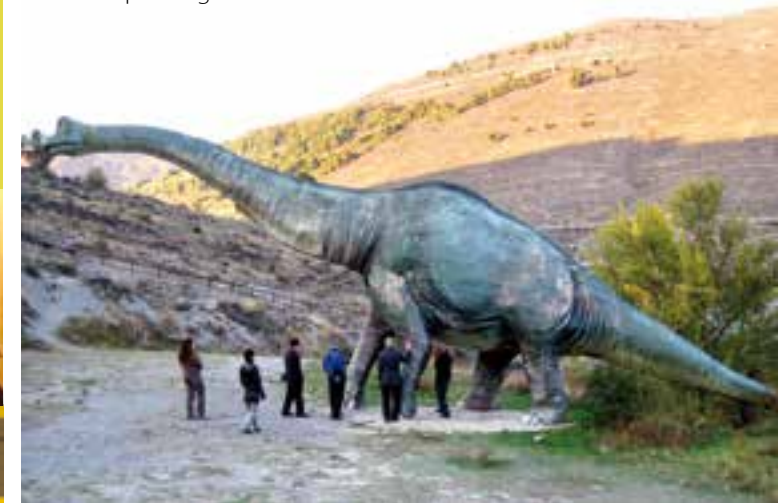
Reproducción de un dinosaurio.

La siguiente parada será Poyales , un yacimiento protegido y con huellas de Theropantigrado encisensis , dinosaurio de pie plantigrado. Terminamos el recorrido por Enciso en la Cuesta de Andorra que conserva la secuencia de pisadas de un ornitópodo que caminaba de forma zamba, con la punta del pie dirigida hacia el interior.